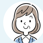
事業型契約者 兵庫県 50代女性(経営者)